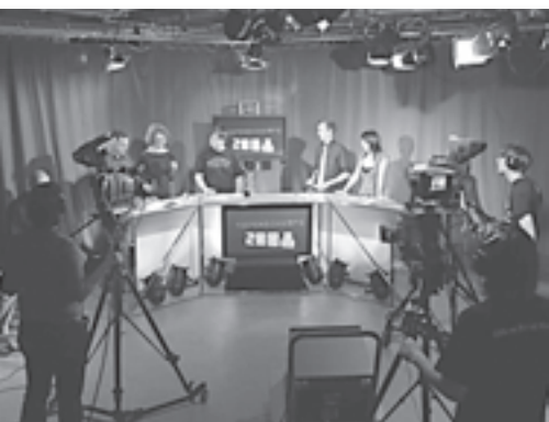
Im OK Kiel startet zum ersten Mal das Videofest „Tiefenschärfe“.